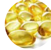
Pro Vitamin B5