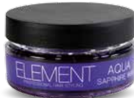
SAPPHIRE WAX AQUA