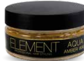
AMBER WAX AQUA