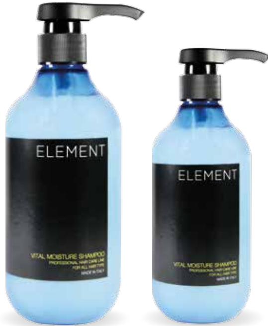
| 1000 ml