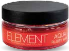
RUBBY WAX AQUA

Kuru veya nemli saça uygulayın. İstedığınız şekli oluşturmak için parmaklarınızla saçın bir kısmına veya tamamına dağıtıp şekil verin.