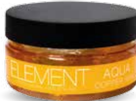
COPPER WAX AQUA