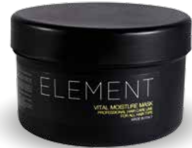
| 500 ml