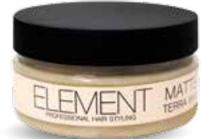
TERRA WAX MATTE